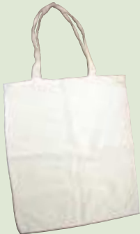
何気なくもっているレジ袋をマイバッグに代えるだけでエコが進む！

2007年1月11日、ジャスコ京都東山二条店（京都市）では、レジ袋有料化の実験が始まりました。これは、今まで無料だったレジ袋を有料（1枚5円）とすることで、買い物客の買い物袋持参を促し、家庭でのレジ袋廃棄量を削減しようというもの。同社の店舗としては全国で初めての取り組みで、地元のNPO団体や主婦グループが協力してバックアップ。買い物客の理解を得て効果を出せるかどうか注目目が集まっています。