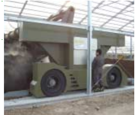
新型機械「MO-618」(キクロスタイヤ 10.00-20 装着)

今月のお客様 榊原機械 株式会社 群馬県北群馬郡榛東村新井685-4 ☎0279-54-2184 http://www.sakakibara-kikai.co.jp