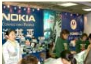
中国でも携帯電話はどんどん普及中。

さて、次はインターネット。昨年末までの加入者は1億3700万人ですが、農林部とは大きな差があり、人口普及率ではまだ10%程度なんだそう。無線通信である携帯電話は中国の広い国土をカバーできる有効なインフラ。農村地域でも早く整備が進んで欲しいものです。ちなみにポータルサイトでは中国でもGoogleやYahoo!が人気ですが、なかには「馬虎」「百度」という名前前の中国独自のサイトも拡大中です。ではまた、次号で！