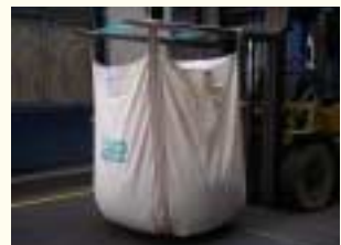
チームの汗がしみ込んでいます(?)

の中！ しかも原料を溶かす温度は200度以上！！ おまけに昨年の夏には猛暑の影響もあって室温が40度以上！！…そんな「サウナ」の中で研究した成果が今、エコソフトバッグとなって皆さまの元へ届けられています。皆さまに喜んでいただければ、チーム一同の感慨もひとしおです。