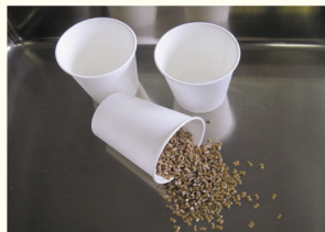
これが「処方箋」の正体! どことなく本当の薬に見えますね。

ちなみに、新しいエコソフトバッグの試作が9月末に決まりました! 新生エコソフトバッグにぜひご期待下さい!