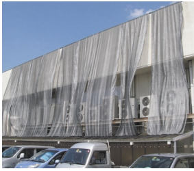
室外機にかけて消費電力を低減させた農業用遮光ネット。

くらこんさんの工場にはたくさんさんのエアコンがあるのですが、室外機の設置場所が建物の西側で、西日の影響で室外機自体が熱をもち、冷却に必要な以上の電力がかかっていたそうです。そこで社員さんのアイデアで、なんと農業用の遮光ネットをかぶせ、消費