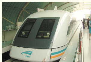
(上) 上海で活躍中のリニアモーターカー。 (下) 企業広告つき電光掲示板に表示される地下鉄の時刻表。

上海にあって日本にないものといえばリニアモーターカー! 浦東空港~龍陽路駅(30km)を約7分、最高速度430kmで走ります。ただ、速くて静かなのはいいのですが、管理やメンテナンスに不安のある中国風土を考えると、ちょっと心配ですね。