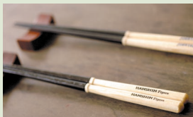
「かっとばし!!」(1800円)。ロゴはプロ野球のすべてのチームが揃っている。

福井県・小浜市に本社を置く「兵左衛門」では、口に入る部分に合成化学塗料を一切使用しない、使い手の心地良さにこだわった漆塗りの箸を製造・販売しています。なかでも人気なのが「かっとばし!!」。これは、プロ・アマを問わず、年間約20万本も消費される木製バットを、プロ野球チームのロゴが入ったお箸へとリサイクルしたものの。バットの材料となるアオダモを再利用した、注目のエコ箸です。