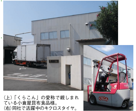
(上)「くらこん」の愛称で親しまれている小倉屋昆布食品様。 (右)同社で活躍中のキクロスタイヤ。

小倉屋昆布食品株式会社(枚方工場) 大阪府枚方市招提田近3-9 ☎072-851-0301 http://www.kurakon.jp