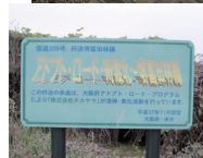
(上) ボランティアで清掃した道路。とってもキレイ! (左) アドプト・ロード・プログラム参加を示す看板。