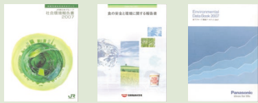
CSRレポートは誰でも無料で取り寄せすることができます。

皆さんは、CSRという言葉をごぞんじですか? CSRとは、Corporate Social Responsibilityの略で、日本語では一般的に「企業の社会的責任」と訳される言葉。「企業は経済だけではなく、社会や環境に対しても有益な存在でなければならない」という考えに基づき、各企業がいかにしてその責任を果たしているかをまとめたものがCSRレポートです。上場企業では当たり前のように作成され、企業サイトなどで閲覧や取り寄せができます。