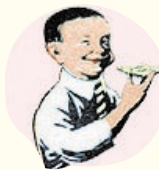
初代のビスコ坊や (昭和8年~昭和25年)