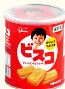
「ビスコのかんづめ」 500円(税別)※

ちなみに余談ですが、おなじみのビスコ坊やの顔、実は初代から数えて5代目だっただこと、知ってました? 初代と比べると、5代目は欧米の人っぽい顔つき。日本人の顔つきの変遷を見るようで、興味深いですね。