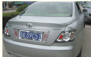
日本のマークXは、「レイク」という中国名で約300万円で販売中。