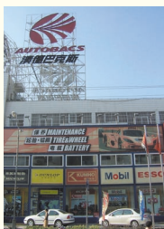
オートボックスの外観は日本とほとんど同じ。

込むわ、譲ろうともしないわで渋滞は一層ひどいものに…。行政は市外で登録された自動車の高架道路進入を禁止する規制をして対策をとっています。一方、郊外は快適で、新しい住宅街では駐車場も整備。オートボックスなどの自動車関連ショップも出現しはじめました(品揃えやサービス面にはまだまだ改善の余地がありますが…)。今後はマイカー客向けのレストランやショッピングセンターが道路沿いに増えてくるでしょう。