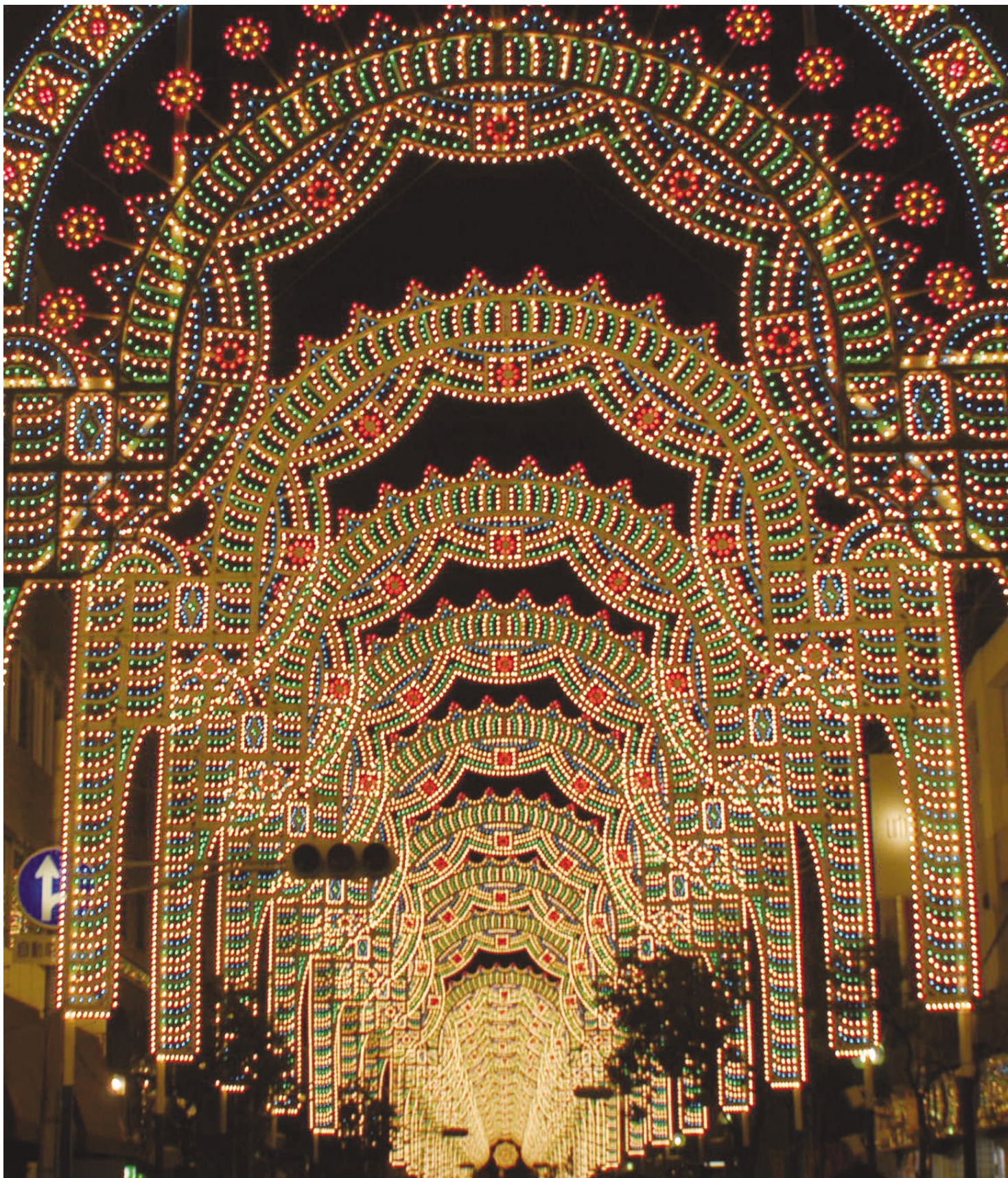
【今回の写真:兵庫・神戸市(神戸ルミナリエ)】

阪神・淡路大震災の犠牲者への鎮魂の意をこめ、街の復興・再生への希望を託してはじまった神戸ルミナリエ。この電飾には約20万個の電球が使われているのですが、昨年は環境への配慮から、使用電力の一部(10,000kWh)に、風力やバイオマスなどの自然エネルギーで発電されたグリーン電力が初めて使われました。これからも環境にやさしいスタイルへと進化しながら、長くつづけていってほしいですね。