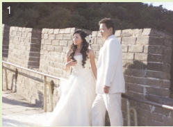
撮影中の新郎新婦。ドレスの下は…(笑)

10月上旬、北京へ観光旅行に行っていました。その時に発見した北京の生の姿を、今回は私がレポートします!