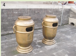
風景に合わせたデザインのゴミ箱