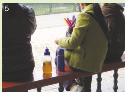
市民の方が持っていた茶葉入りマイボトル

北京五輪の影響もあり、北京市の発展は想像以上。巨大ビルや幹線道路が無数に立ち並び、道路には車があふれていました!