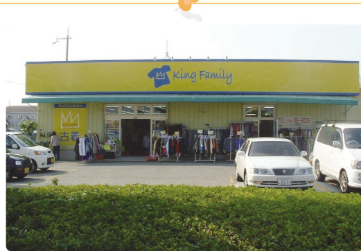
一号店外観。今では全国的に店舗を増やし、リユース・リサイクルを促進している。