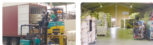
東南アジアやアフリカ・南米等に輸出出荷。服が一時保管されるリサイクル拠点。