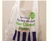
イギリス大手スーパーではレジ袋削減エコキャンペーンを実施。

私の出身のチェコもレジ袋有料化の店が増えていますが、エコへ関心度は日本ほどはないように思います。