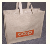
チェコのエコバッグ。使いまわししやすい。