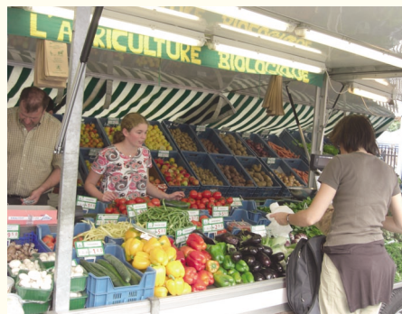
ベルギーの屋外マーケットで、買い物の際にカバンが袋を持参する顧客。レジ袋ではなくマイ袋を持ち歩く人が多く見られたそう。