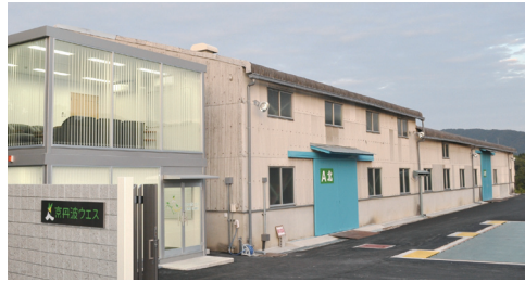
↑工場「京丹波ウエス」。収益の一部は「ピンクリボン活動」に寄付

当社では古着をリサイクルするための工場「京丹波ウエス」を開設。着なくなった古着を選別、国内外でのリユース(再利用)に向けた加工を施しています。廃棄から焼却処分される古着を減らし、焼却時に発生するCO2の削減を目指しております。この工場の収益の一部は寄付し、社会貢献活動の一助となるように努めています。