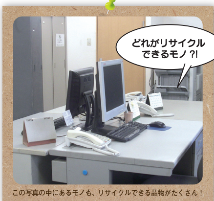
この写真の中にあるモノも、リサイクルできる品物がたくさん!

例えばオフィスでは机やロッカー。家庭では家電リサイクル法対象商品以外の製品やパソコン。また工具や自転車、健康器具やウィンドクローラーなども弊社に入っています。車のアルミホイールや銀食器、水道の蛇口は意外と高値でリサイクルされています。