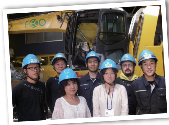
事業部メンバー。ユンボとたくさんの金属に囲まれた工場現場にて