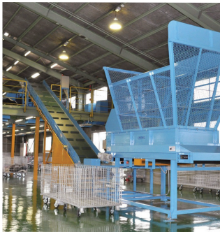
↑株式会社山本清掃の工場内