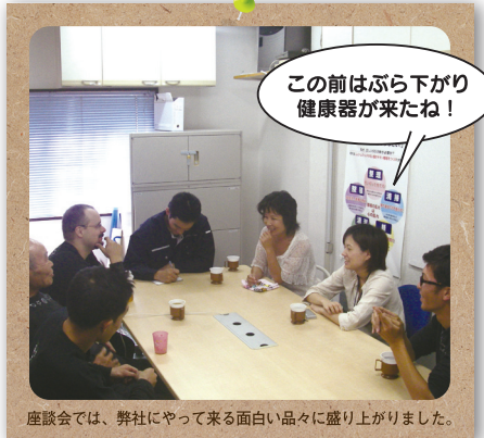
座談会では、弊社にやって来る面白い品々に盛り上がりました。