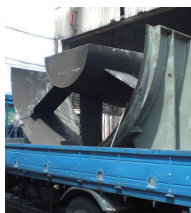
高速道路の換気設備から撤去した金属部材

近畿地区の高速道路工事において、撤去する金属部材の買い取りを依頼。その後、全国的に対応ができるとのことだったので、現在は九州から関東まで撤去部材の売買取引でお世話になっています。リメタル事業部のレスポンスが早く、細やかに対応してくれるところも助かっています。