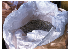
皆様からいただいた 善意のプルタブで袋がパンパン!