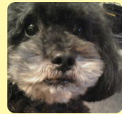
愛犬のトイプードル♡カットしてサッパリ(^^)♡可愛くなりました!!