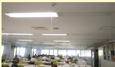
事務所内照明の単独スイッチ

社内で環境に配慮した取り組みを実践しています。例えば、冷暖房の設定温度制限は冷房28℃、暖房19℃に抑える、照明器具の単独スイッチ使用（不要箇所の照明オフ）、ゴミの分別収集と資源ゴミの回収など。これからも出来る限り実践していく予定です。